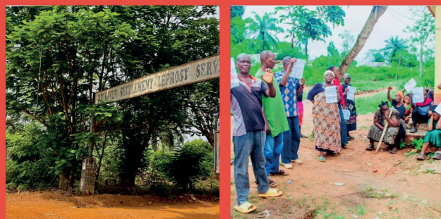
JUHOR Lepra centrum, Orji Rivier, Nigeria 'Sustenance and Dignity'

Voor het 'Sustenance and Dignity' initiatief is ₦ 7.060.000,- (ongeveer €4.500,-) nodig om de kwaliteit van leven door goede voeding en medische (hulp)middelen te verbeteren voor een periode van 6 maanden. Het geld zal gebruikt worden voor inkoop en levering van basisvoedingsmiddelen, en een volledig assortiment farmaceutische producten met o.a. wondverzorgingssets, hygiënische producten, beschermende sandalen en 10 rolstoelen. Uw giften zijn in de periode van Aswoensdag tot aan Pasen ingezameld.