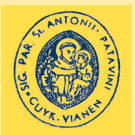
H. Antonius van Padua - Vianen